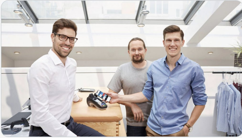
Photo parfaite (les bras croisés dans le dos sont d'une originalité folle) https://t.co/2LI891ndg7

Le service de paiement mobile Stocard Pay débarque en France dlvr.it/Rm1b4k